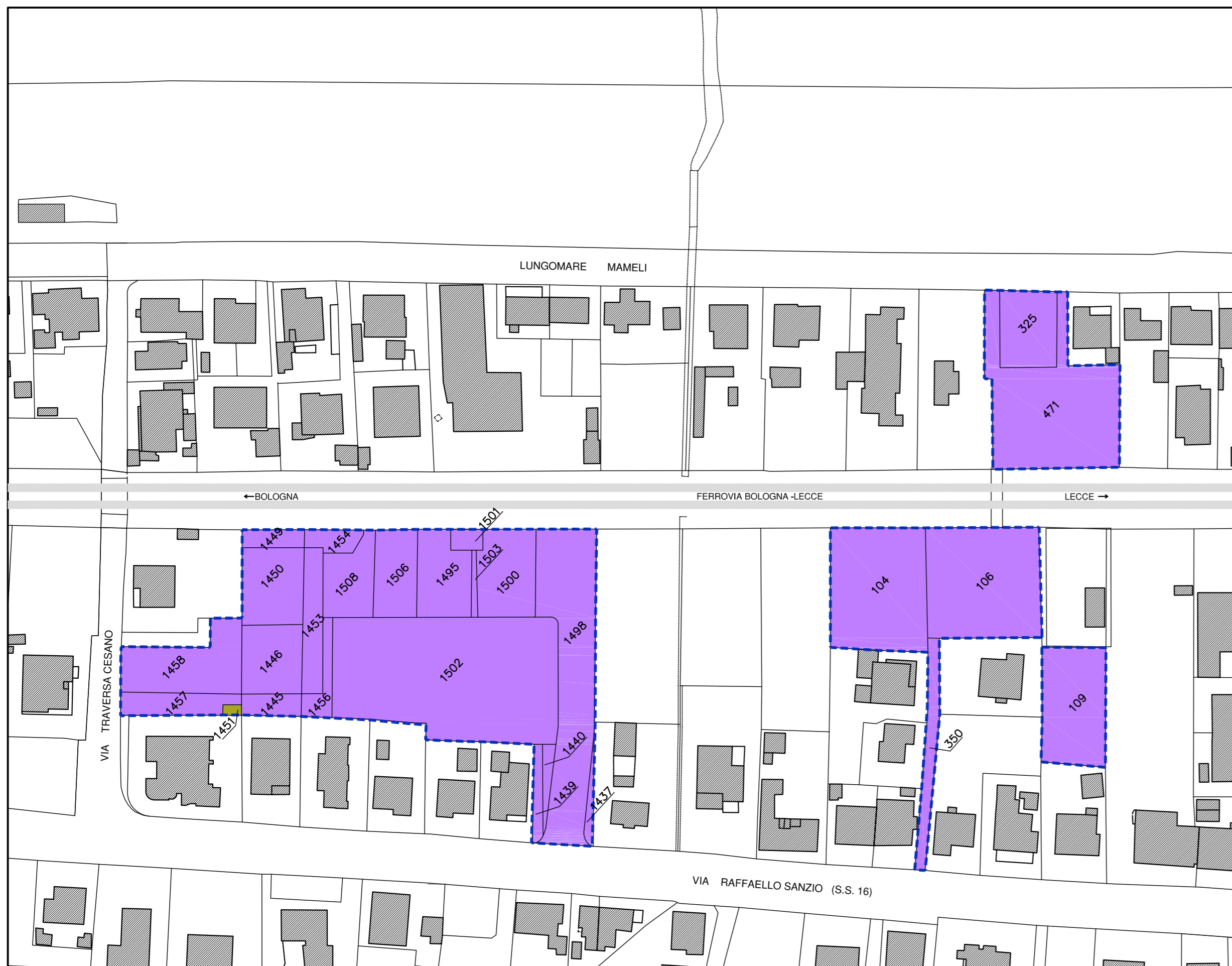
STRALCIO CATASTALE – FOGLIO 3 (COMUNE DI SENIGALLIA)